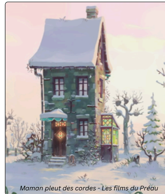
Maman pleut des cordes - Les films du Préau