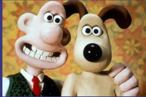
Pâte à modeler