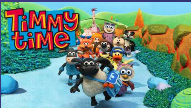
Voici Timmy (Timmy Time) de Nick Park (Série : 3 saisons 82 épisodes, 2009-2012, Angleterre)