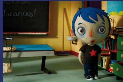
Animation de marionnettes