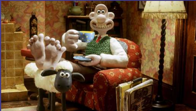
Wallace & Gromit : Rasé de près (Wallace & Gromit: A Close Shave) de Nick Park (1996, Angleterre, 30mn)

Shaun le mouton, le film (Shaun The Sheep Movie) de Mark Burton et Richard Starzak (2015, Angleterre, 85mn)