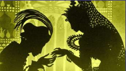
Silhouettes en papier découpé