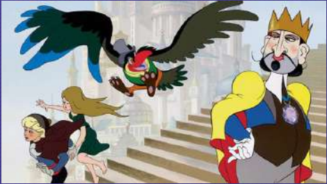
Dessin animé (sur cellulo)