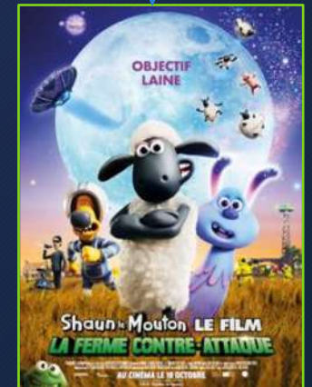
Shaun le mouton, le film : La Ferme contre-attaque (A Shaun the Sheep Movie : Farmageddon) de Will Becher, Richard Phelan (2019, Angleterre, 90mn)