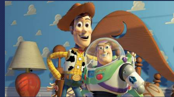
Images de synthèse