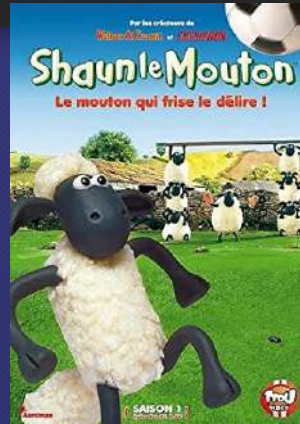
Shaun le mouton (Shaun The Sheep) de Nick Park (Série : 5 saisons 150 épisodes, 2007-2016, Angleterre)