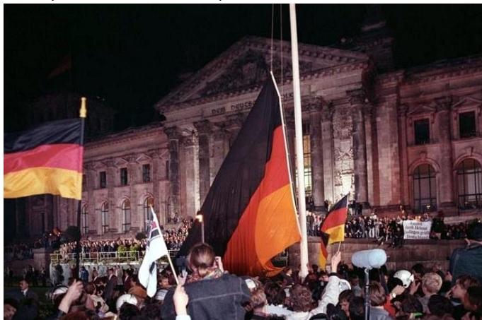
Nuit du 2 au 3 octobre 1990 devant le Reichtag, Berlin

Bien sûr, ce serait une date toute trouvée pour la fête nationale si, hélas, elle ne coïncidait pas avec celle de la "nuit de cristal" en 1938. Rappelons que cette nuit-là, les dirigeants nazis commirent le premier grand pogrom contre les juifs. Du coup, on s'accorde sur le 3 octobre, qui un an après la chute du mur, est la date officielle de la réunification des deux Allemagnes. ! Même si celle-ci se fait nettement plus discrète que la fête nationale française sans bals des pompiers ni grands artifices, la fête du 3 octobre représente depuis 23 ans un symbole d'unité fort pour de nombreux Allemands.