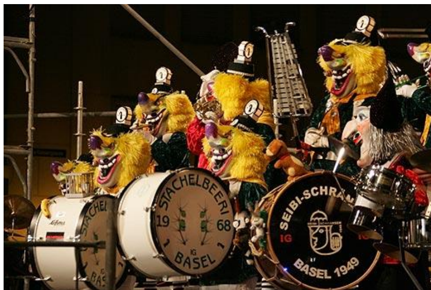
Carnaval de Bâle

Fastnacht ou Fasching en allemand. "Fasten" veut dire faire carême, "Nacht" la nuit. Fastnacht est donc la nuit précédant le carême. Fasching est le mot utilisé au départ en Bavière et en Autriche. Ce mot s'est répandu entre temps dans toute l'Allemagne. Carnevale (mot italien, de carne = viande) veut dire : le dernier jour où l'on mangeait de la viande avant le mercredi des cendres. C'est de là que vient le mot carnaval ou Karnaval en allemand.