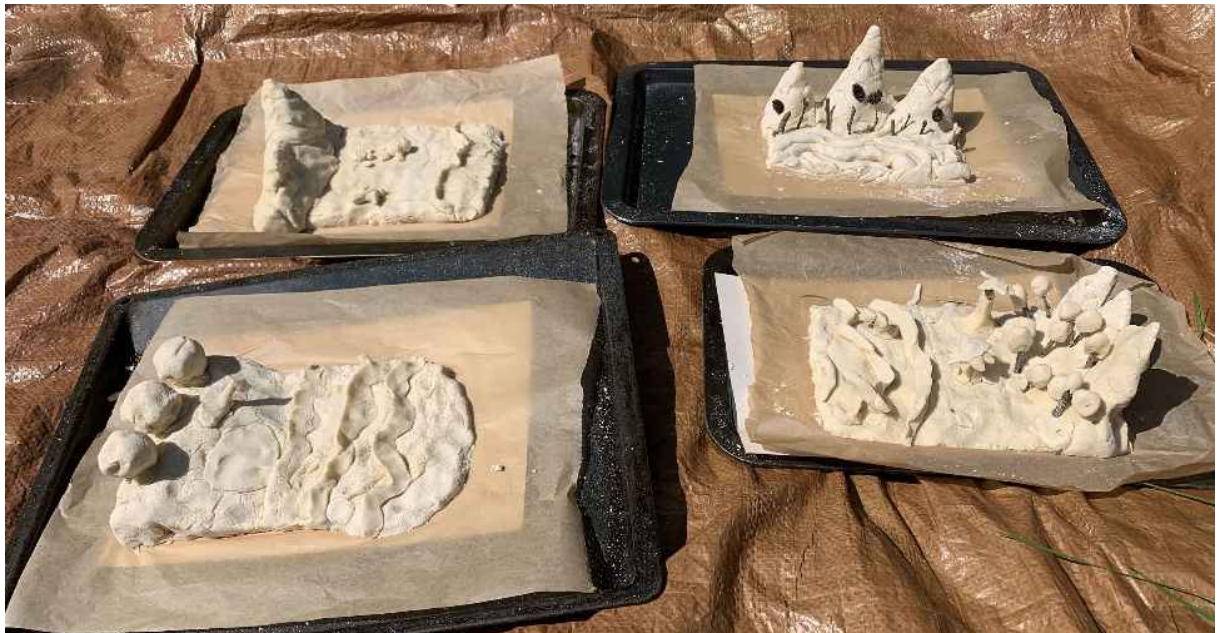
4 œuvres faites en forêt